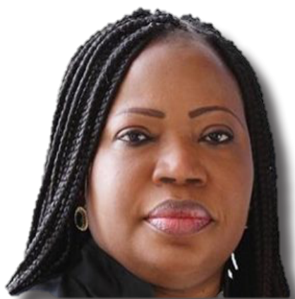
Fatou Bensouda 25 fiscal de la CPI

El 18 de diciembre de 2019, tras una «evaluación exhaustiva, independiente y objetiva», la Fiscal de la CPI anunció que «el examen preliminar de la situación en Palestina había concluido con la determinación de que se han cumplido todos los criterios legales establecidos en el Estatuto de Roma para la apertura de la investigación». El 22 de enero de 2020, la Fiscal Fatou Bensouda solicitó a la SCP «un fallo jurisdiccional» para confirmar que la Corte puede ejercer su jurisdicción sobre Cisjordania, incluida Jerusalén Oriental, y Gaza.